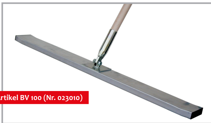
Artikel BV 100 (Nr. 023010)